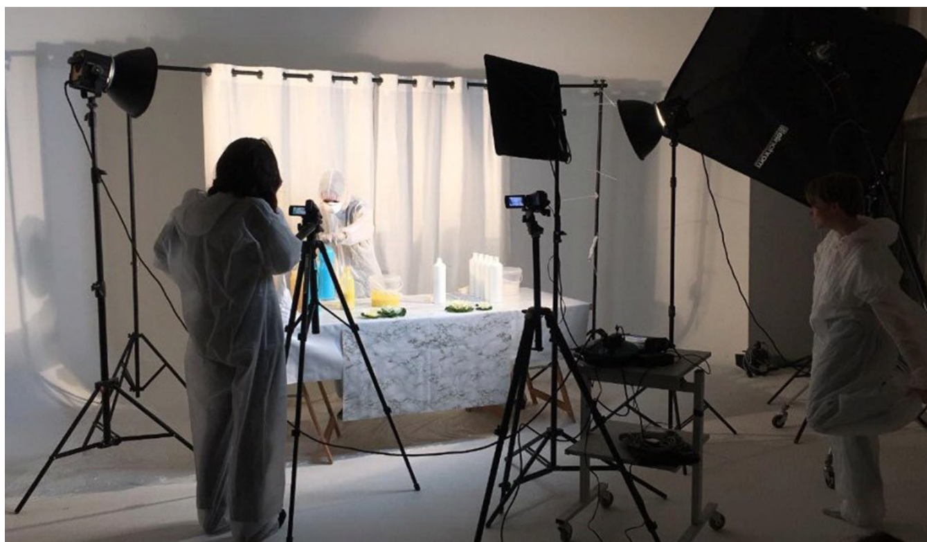
Tournage vidéo , Classe préparatoire des Beaux arts de Marseille.

3/ Faire découvrir toutes les étapes d'un tournage vidéo en studio.