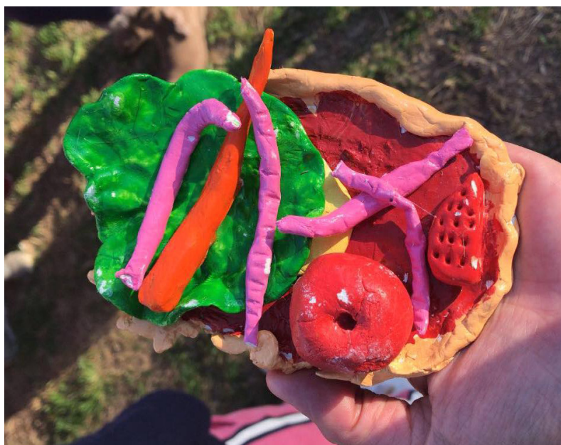
Atelier Sculpture Tarte salade-pomme-verre de terre-carotte-fraise- 3-5ans

Je suis convaincue que l'artiste doit s'inspirer des faits sociétaux dans son art, je pense entre autres aux happenings de Fluxus qui prônent la participation des spectateurs, qui ouvre l'art vers de nouveaux territoires : « L'art est un outil de libération face à l'aliénation social et apporte des transformations plus radicales » Allan Kaprow