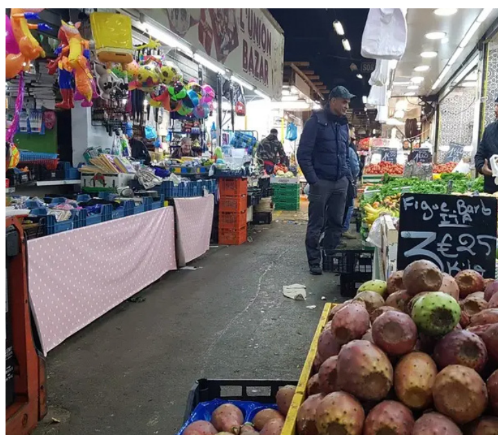
Marché aux puces Bougainville Gèze

4/ Participer à la vie du quartier et favoriser leur estime de soi.