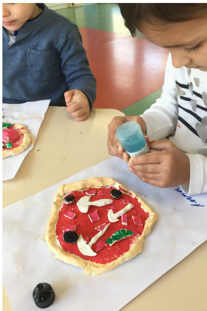
Atelier Sculpture Pizza 3-5ans