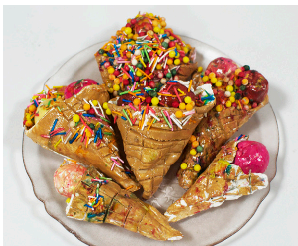
Atelier Sculpture Glace 3-5 ans