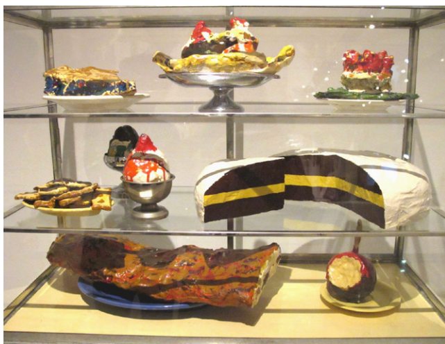
Claes Oldenburg, Pastry-case I, 1961-62, Plâtre, pain, émail, bois, plat en céramique sur plaque de verre et métal, New-york, Moma