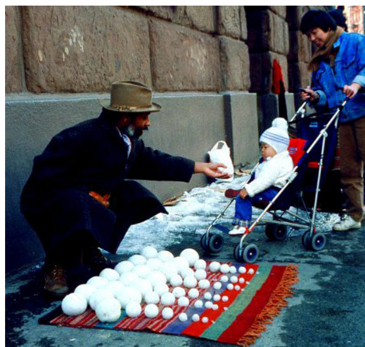
David Hammons Bliz-aard Ball Sale (1983)- performance.